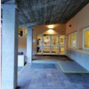
Ponte di Legno