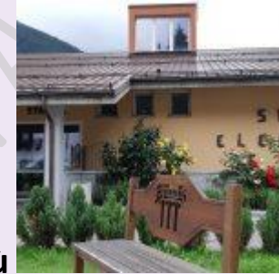
Ponte di Legno